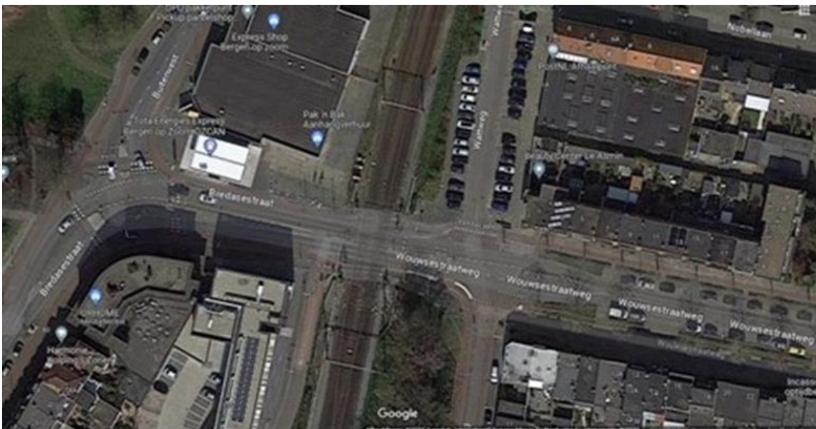
Bergen op Zoom, 5 juni 2023